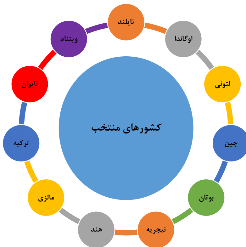
شکل ۱: کشورهای منتخب در مطالعه تطبیقی

پیش از جنگ جهانی دوم، شوروی سابق نخستین کشوری بود که برنامه‌ریزی توسعه (اقتصادی) را آغاز کرد و هدف از برنامه‌ریزی در این کشور، دستیابی به رشد اقتصادی و گذار از یک سیستم دهقانی به سمت یک سیستم صنعتی بود. علاوه بر این، شمار کشورهایی که به نحوی برنامه‌ریزی توسعه را تجربه کرده‌اند بسیار است که در این مطالعه تلاش شد بر اساس معیارهایی مشخص، جامعه مطالعاتی محدود گردد تا بدین طریق بتوان با مقایسه تطبیقی برنامه‌های توسعه در کشورهای هدف، نکات قابل توجه احصاء شود و در اختیار برنامه‌ریزان قرار گیرد. در ادامه بر اساس معیارهایی اعم از سابقه برنامه‌ریزی توسعه، دسترسی به اطلاعات و تنوع طیف مورد بررسی بر اساس قلمرو جغرافیایی و توسعه یافتگی، ۱۱ کشور انتخاب و مورد مطالعه تطبیقی قرار گرفت.