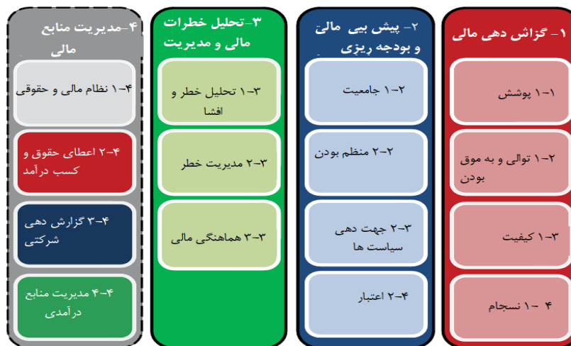
چهار رکن کد جدید

نمودار ۱-۱: مهندسی کد شفافیت مالی تجدیدنظر شده