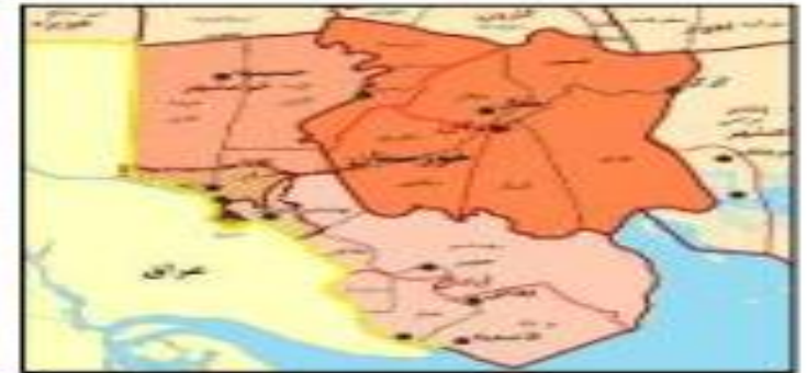
جایگاه منطقه آزاد اروند در تقسیمات سیاسی (راست)، محدوده منطقه آزاد اروند مصوبه سال ۱۳۸۴ هیئت دولت (وسط)، افزایش محدوده منطقه آزاد اروند سال ۱۳۹۲ (چپ)

چالش: قطع کامل منابع درآمدی شهرداری ها مانند عوارض ادارات و دستگاه های ممتول (بندر، گمرک، نفت و گاز، صنایع تولیدی و کارخانجات و صنایع کشتی سازی های بزرگ و حمل و نقل) و واریز آن به حساب سازمان منطقه آزاد عدم تعیین سهم ارزی مناطق آزاد جهت واردات. سردرگمی ادارات دولتی مستقر در منطقه در سیاست گذاری و پاسخگویی به مقام حاکمیتی مستقر نشدن گمرک جمهوری اسلامی در گیت های خروجی منطقه آزاد